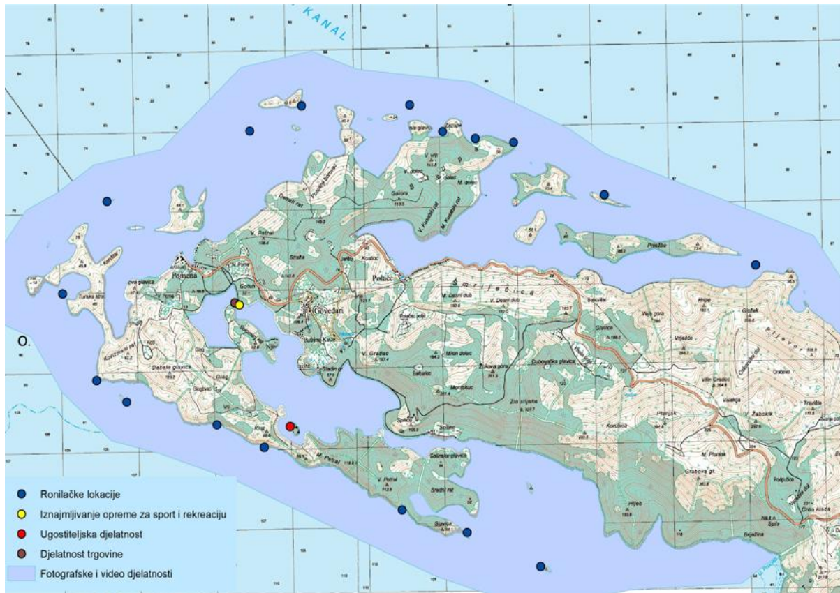
Slika 3. Kartografski prikaz lokacija dozvola na pomorskom dobru