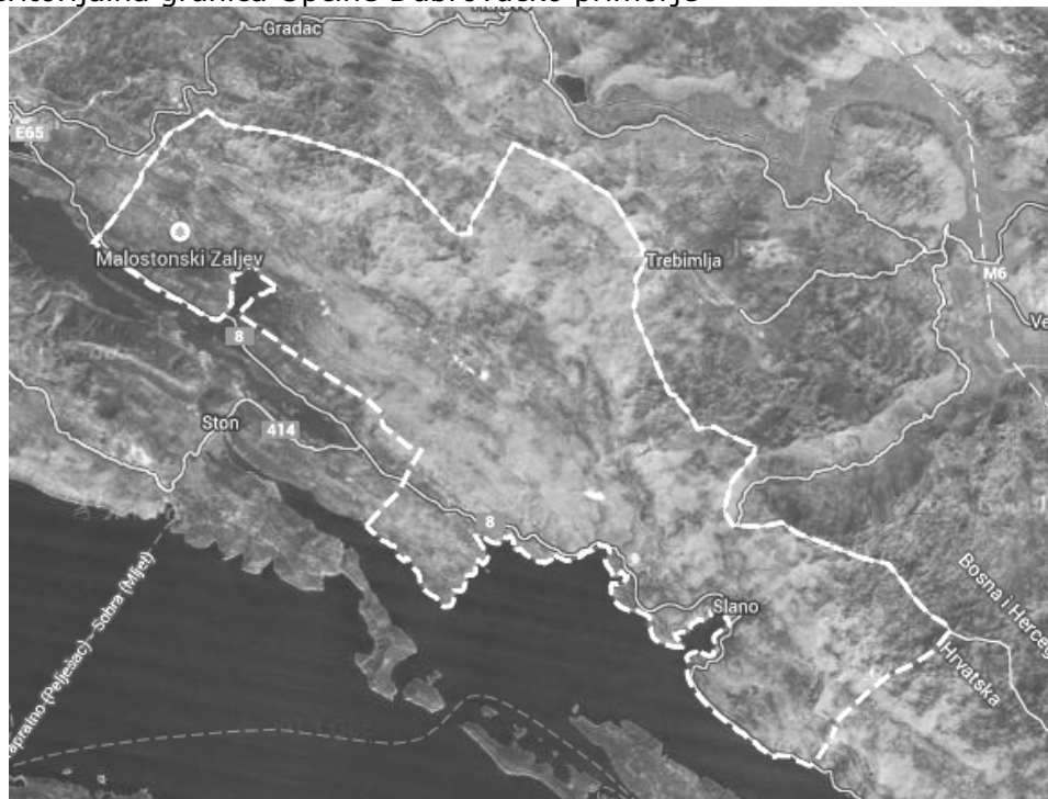
Slika 1.: Teritorijalna granica Općine Dubrovačko primorje

Općina Dubrovačko Primorje ima prema popisu stanovništva iz 2011. godine 2.170 stanovnika. Prema tom popisu broj stanovnika po naseljima iznosi: