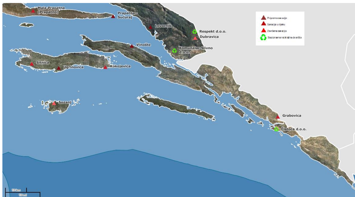
Slika 1. Odlagališta na području Dubrovačko-neretvanske županije