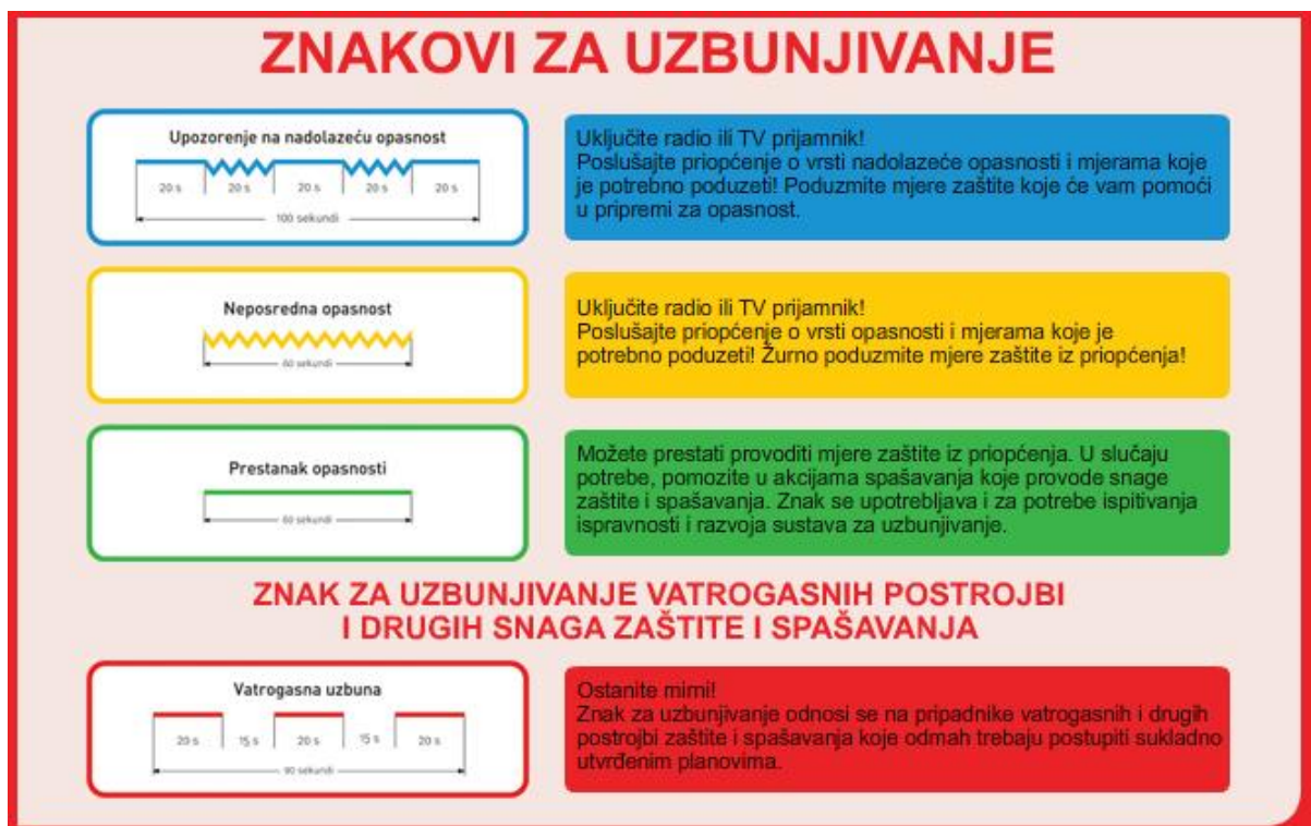
Slika 1. Znakovi za uzbunjivanje stanovništva

Upozoravanje stanovništva u slučaju nadolazeće i neposredne opasnosti obavlja se propisanim jedinstvenim znakovima za uzbunjivanje.