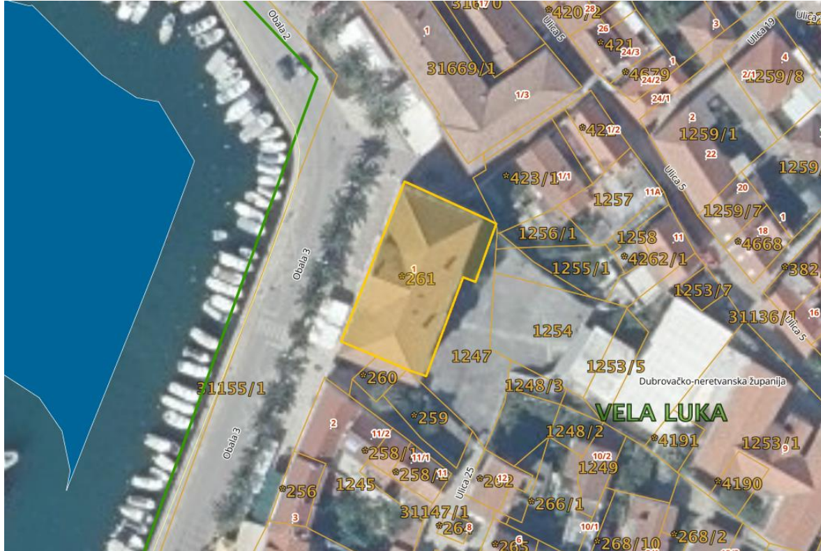
fotografija: Zajednički informacijski sustav zemljišnih knjiga i katastra - ZIS OSS, podloga: Digitalni ortofoto 2019/20

Investitor raspolaže podlogama kao što su: postojeća tehnička dokumentacija školske zgrade (arhitektonski i geodetski snimak).