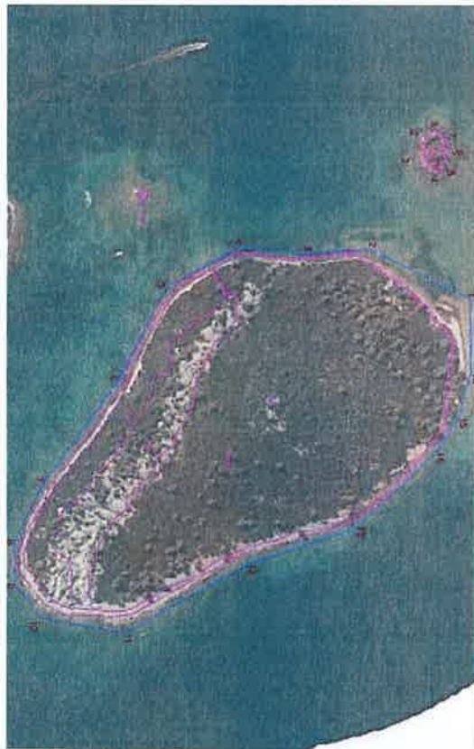
Izuzetak unutar Lučkog područja Luke Badije – Otok Planjak i Baretica M=1:3000