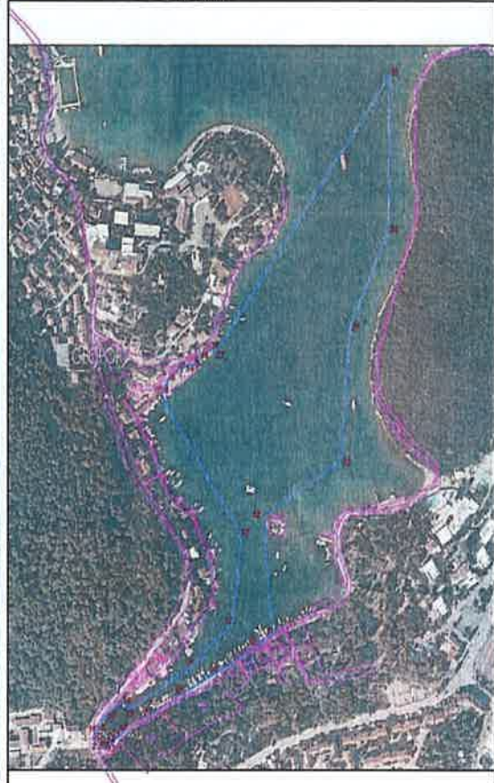
Lučko područje "Luka Korčula – Luka" M=1:3000