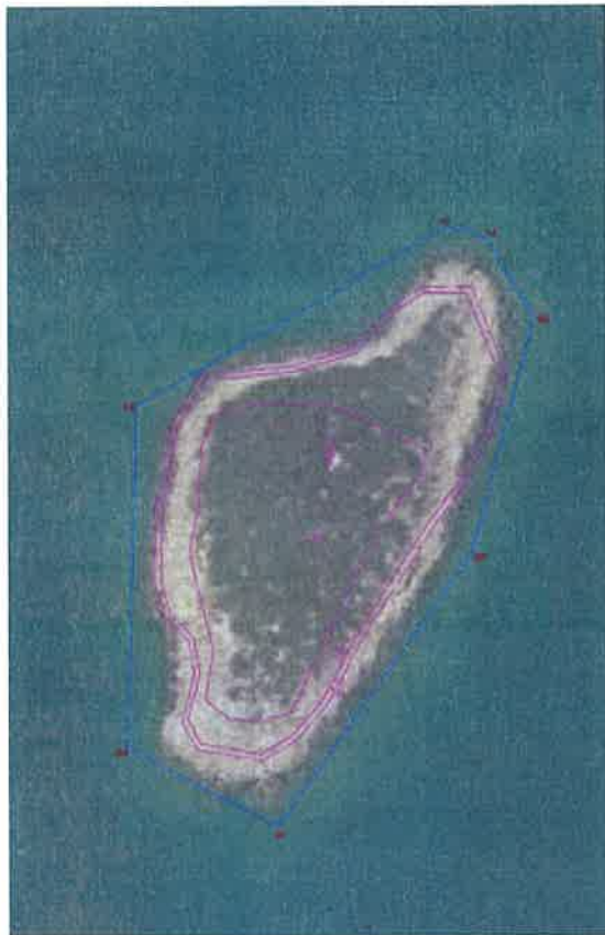
Izuzetak unutar Lučkog područja Luke Badlje – Otok Gopjak M=1:5000