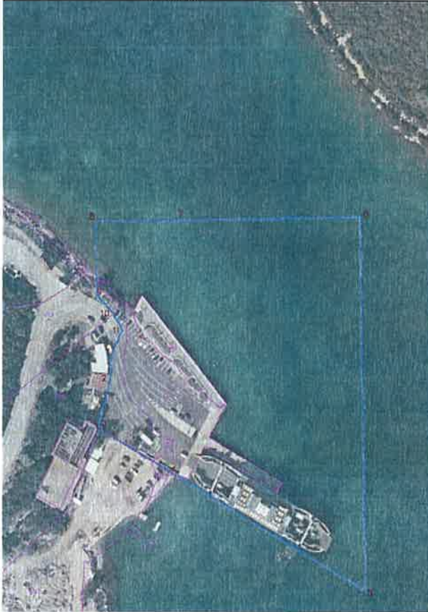
Lučko područje "Luka Daminče" M=1:1000