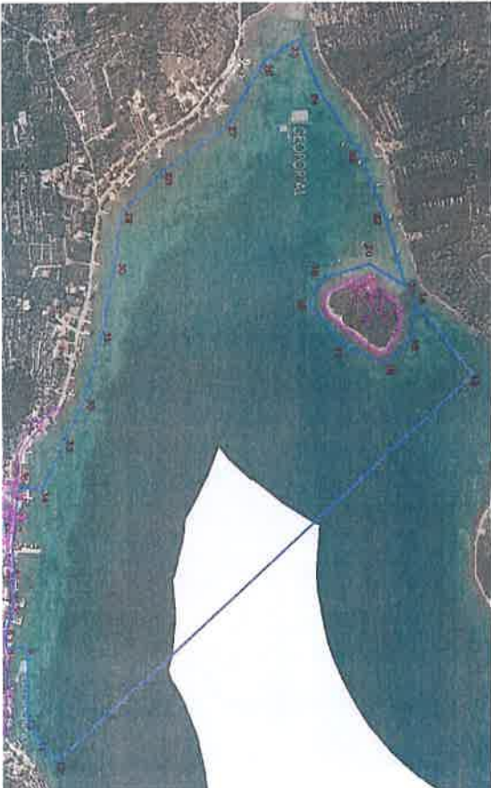
Lučko područje "Luka Pupnat – knežo" M=1:1000