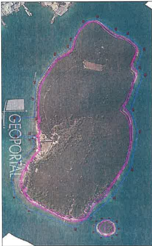
Izuzetak unutar Lučkog područja Luke Badlje – Otok Badlja i Rogočić M=1:5000