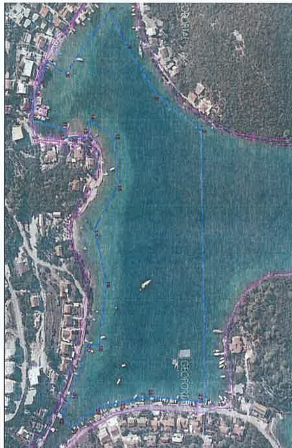
Lučko područje "Luka Žrnovska Banja – Porto banja" M=1:2000