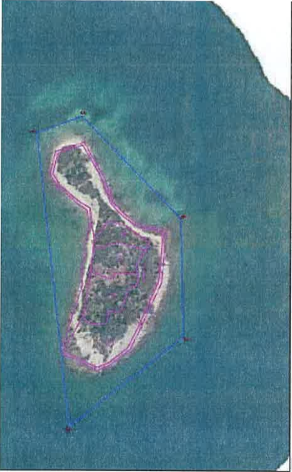
Izmetak unutar Lučkog područja Luka Badijs – Otak Gubavac M=1:2000