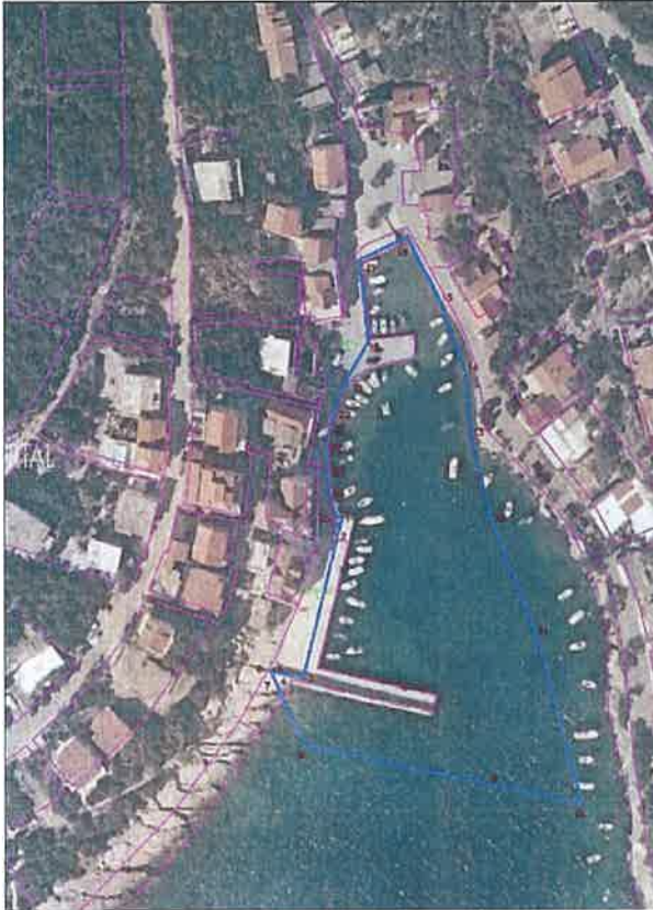
Lučko područje "Luka Zavalatica" M=1:1000