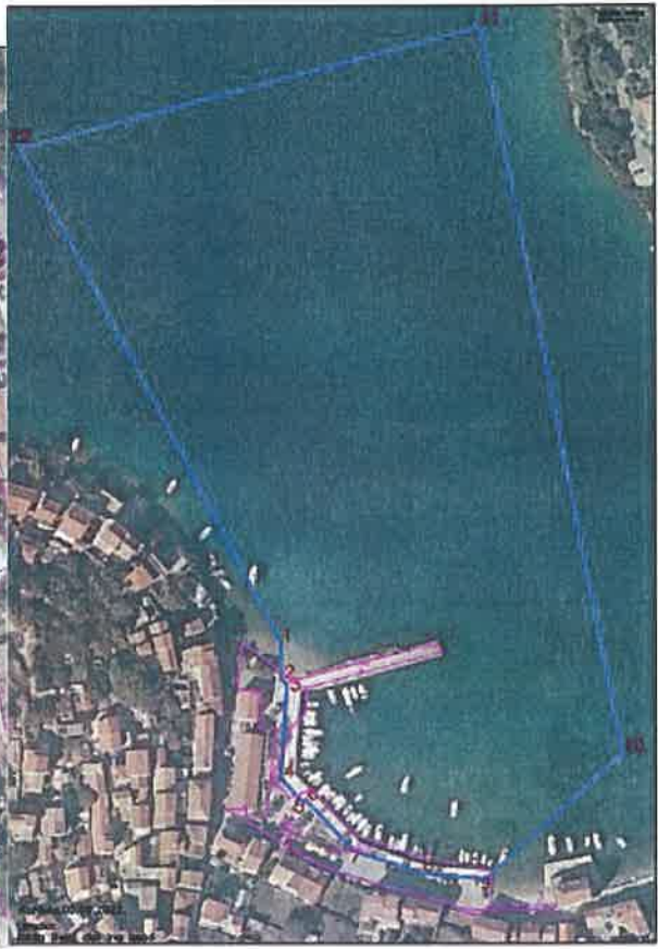
Lučko područje "Luka Pupnat – Pupnatska luka" M=1:1500